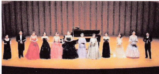
ゴールデンコンサート