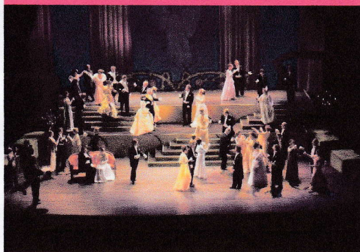
F. レハール 喜歌劇「メリー・ウイドウ」